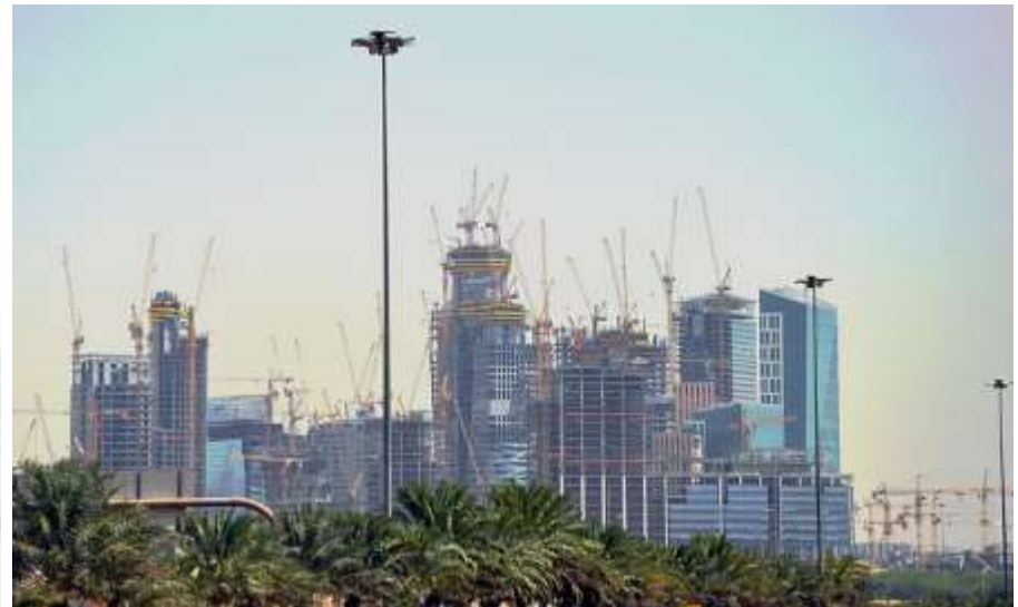
Mekka: Tradition weicht der Moderne

"Ikhwan" by Its author died in 1915 in Jerab - "Arab Alshraa", 1950. Licensed under Public Domain via Commons - https://commons.wikimedia.org/wiki/File:Ikhwan.jpg#/media/File:Ikhwan.jpg