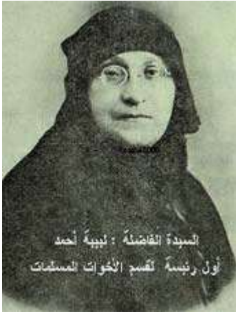
Labiba Achmed, Vordenkerin des politischen Islam in Ägypten, 20er Jahre