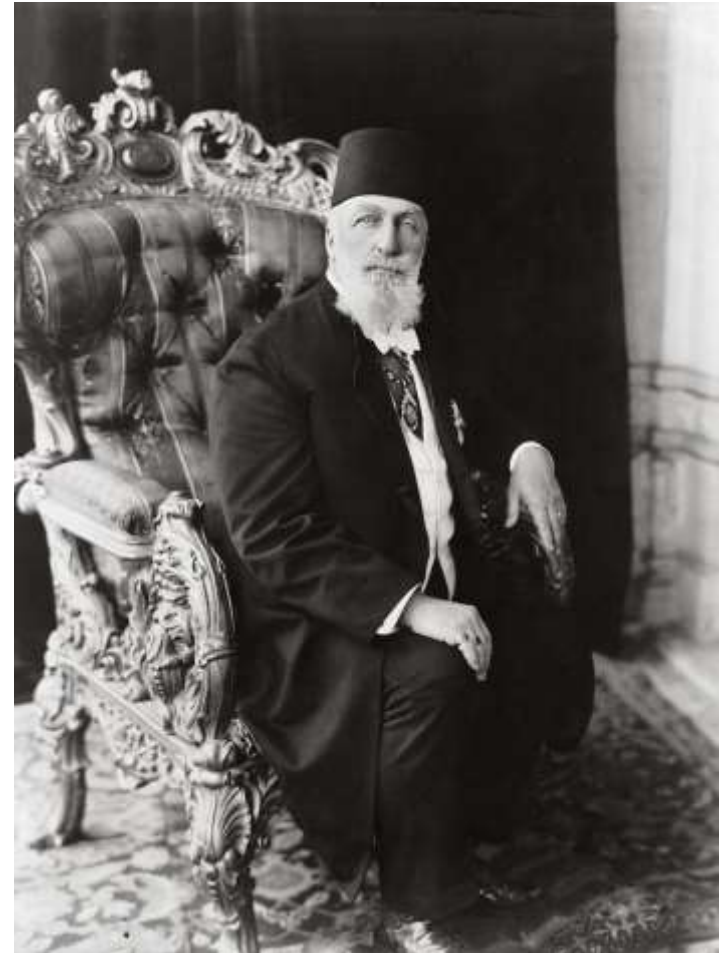
Der letzte Kalif Abdülmecid II. (1923)