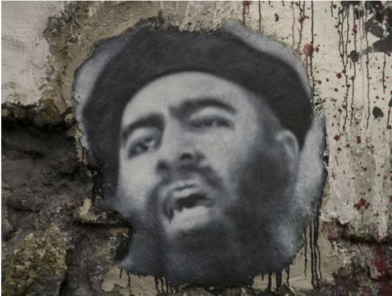
Selbst ernannter Kalif, geboren 1971 als Ibrahim Awad Ibrahim al-Badri