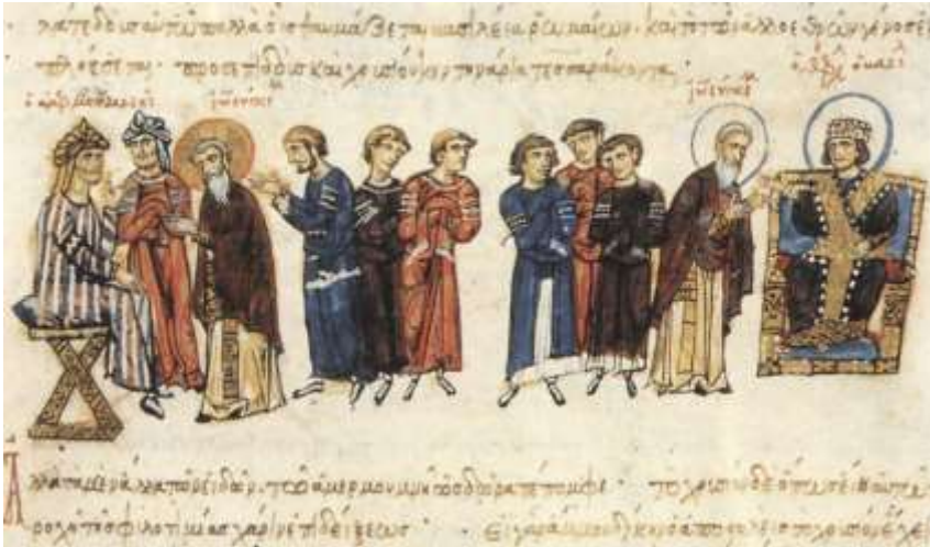
Die Byzantinische Botschaft vom Patriarch Johannes VII. Grammatikos in 829 - der abbasidische Kalif Al-Ma'mūn (links) und der byzantinischer Kaiser Theophilos(rechts); Detail aus der Madrider Bilderhandschrift des Skylitzes