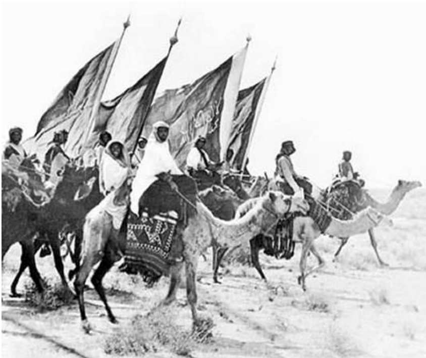
Saudische Kamelreiter um 1920

Verbindung von Traditionalismus und Moderne in Saudi-Arabien