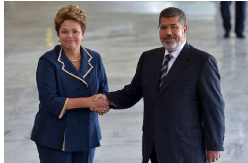
Mohammed Mursi (ägyptischer Präsident aus der Muslim-Bruderschaft, gestürzt 2013 mit der brasilianischen Präsidentin Dilma Rousseff)