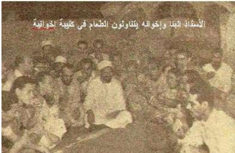
Versammlung von Muslim-Brüdern, Ägypten, 30er Jahre

„Labiba Ahmed“ von Heshamdiab16 - http://www.ikhwanonline.com/Article.asp?ArtID=6650&SecID=372 . Lizenziert unter Gemeinfrei über Wikimedia Commons - https://commons.wikimedia.org/wiki/File:Labiba_Ahmed.jpg#/media/File:Labiba_Ahmed.jpg