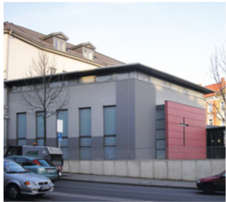
Freikirchen, Freie Gemeinden