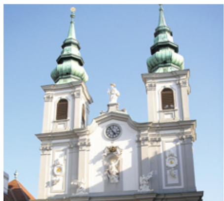
Katholische Kirche (römisch-katholische Kirche)