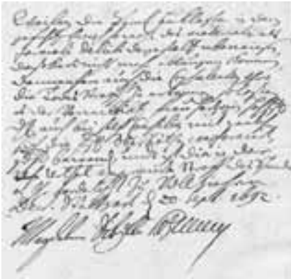
Das Todesurteil. Dekret der Herzogin Magdalena Sibylla vom 20. September 1692.