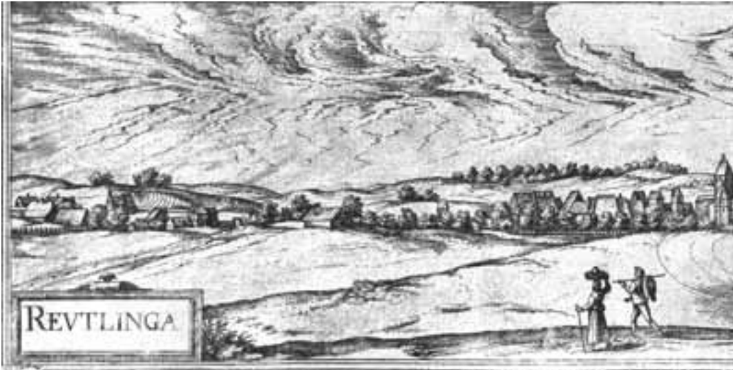
Der Weg Agnes Klingensteins vom „Graben“ bis zum „Siechhaus“. Ansicht von Reutlingen im Atlas von Braun/Hogenberg, Köln 1617.

haus 15 , allwo sie einen Stein von ohngefähr 2 Pfund zu dem Kind hineingeschoben, in Meinung solches sollte zu Boden fallen, es aber nicht geschehen, sondern nachdem sie es in das Wasser gelegt, sei es ob dem Wasser daher geschwommen, sie aber habe es nimmer langen können.“