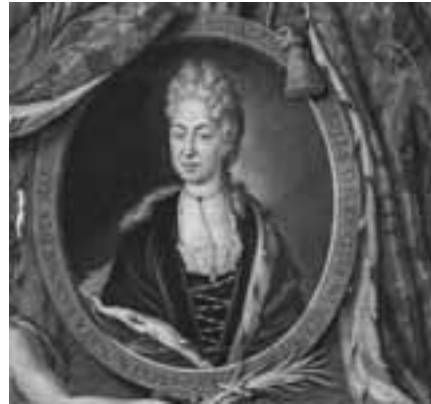
Herzogin Magdalena Sibylla (1652–1712), 1677–1693 regierende Herzogin von Württemberg. Kupferstich von 1712.

genen und bekandten Mißhandlung, dem Nachrichter an seine Handt und Band gelüfert von demselben zuer gewöhnlichen Richtstatt geführt, allda ihr zurr wohlverdienten Straff, andern aber zum abscheülichen Exempel, mit dem Schwerdt, vom Leben zum Todt gerichtet werden solle.“ 44