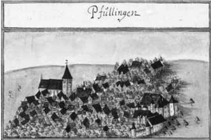
Ansicht von Pfullingen, Aquarell von Andreas Kieser, um 1680/1690.

über Agnes, dass „kein Kind an den Tag kommen“ war und sie sich von Pfullingen hinweg nach Stuttgart und Esslingen „in den Dienst begeben“ hatte. Dort soll sie sich „dem Ruf nach, mit abtragen 3 und sonst sehr übel gehalten haben“. 4