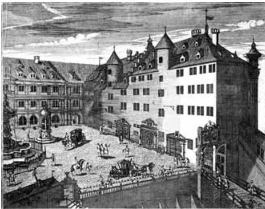
Die fürstliche Kanzlei in Stuttgart, Sitz des Oberrats. Kupferstich von Theodor Hopfer 1685/86.

angegebenen Hanns Jacob Gumpper hast du denselbigen nunmehr der verhaftt wider zu erlassen.“