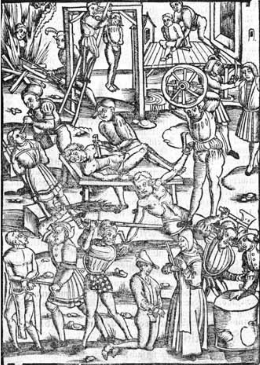
Folter- und Hinrichtungsarten. Holzchnitt aus dem „Laienspiegel“ des Ulrich Tengler, 1509.