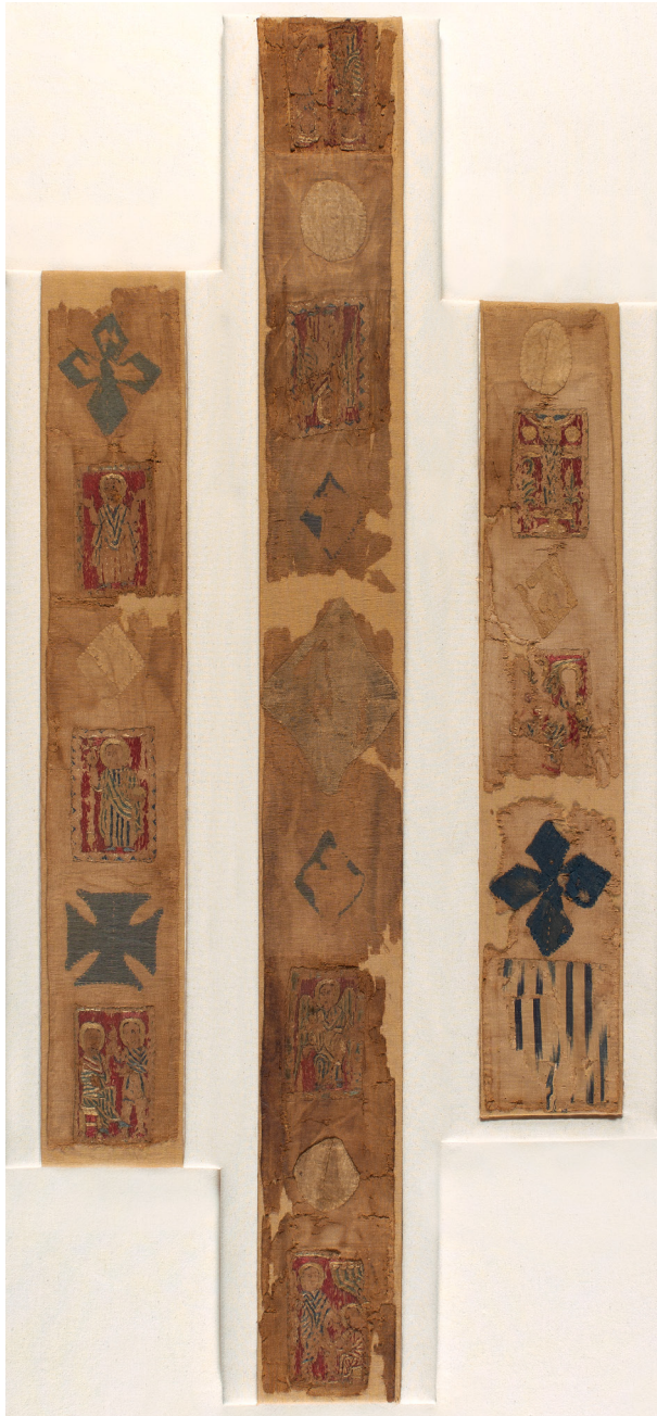
Abb. 3: Frühmittelalterliches Pallium aus Ägypten, Berlin, Skulpturensammlung und Museum für Byzantinische Kunst, inv. 9182, 9185, 9187, 9188.