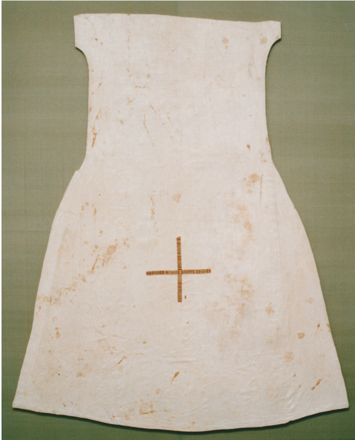
Abb. 2: Frühmittelalterliche Albe aus dem Reliquienschatz von St. Severin, Köln. Das Kreuz wurde nachträglich aufgesetzt.

Eine von Dalmatik und Albe abweichende Tunika hat sich unter den Gewand-Reliquien des Caesarius von Arles, Bischof für Gallien in den Jahren 502-542, erhalten. Es handelt sich um eine braune Wolltunika mit schmalen Ärmeln, die keine Verzierung aufweist. 10 Gebrauchspuren sowie eine Radiokarbon-Datierung in den Zeitraum 431-620 machen wahrscheinlich, dass diese Tunika tatsächlich aus der Zeit des Caesarius stammt. Ob diese Tunika von Caesarius während der Liturgie getragen wurde, bleibt allerdings offen.